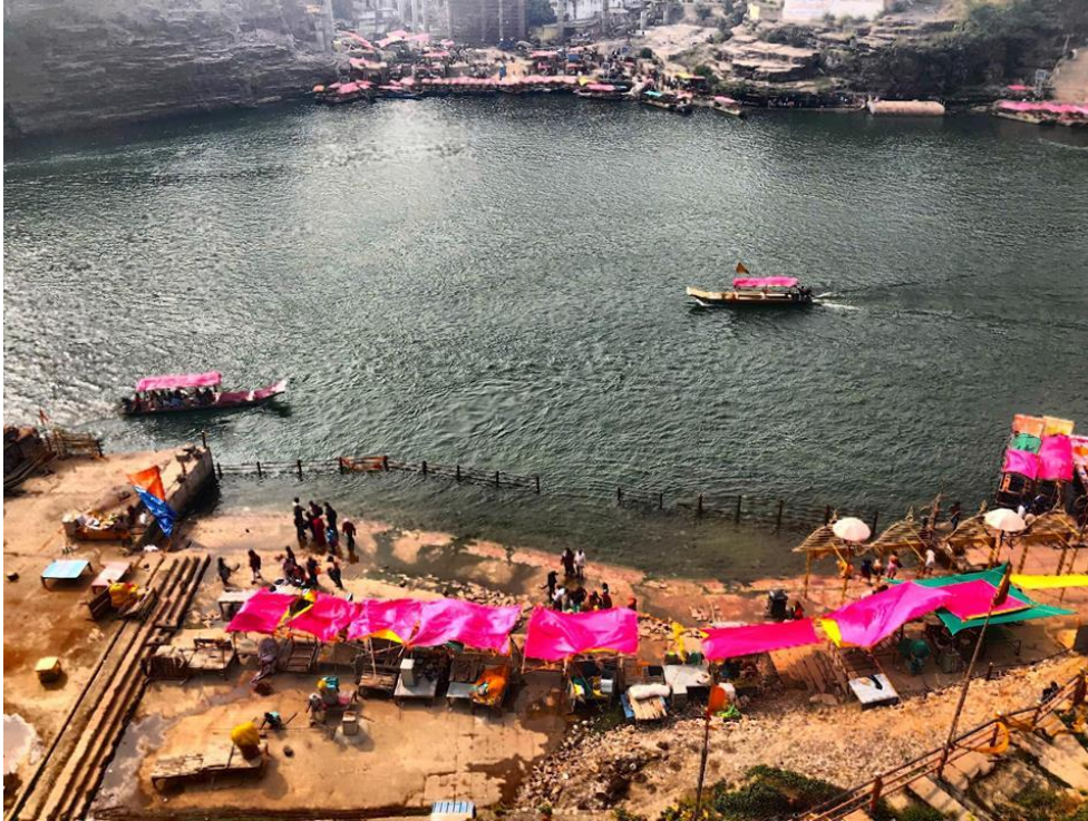
Rengetegen zarándokolnak el a Jyotirlinga kegyhelyhez, a Shree omkar Mandhatahoz.