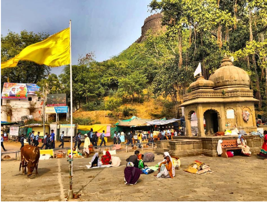
Maheswarba egy dicsőséges város volt az Indiai Birodalom hajnalán, Mahishati néven a Kartivarjun király fővárosaként